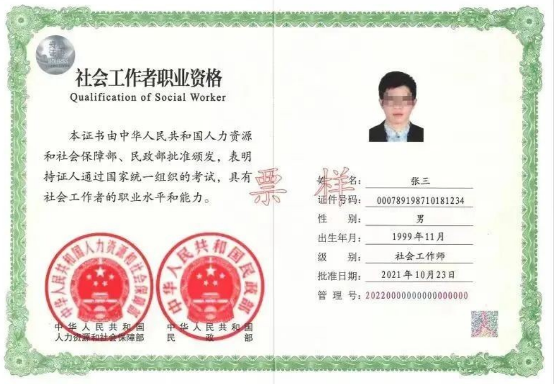
水平评价类专业技术人员职业资格证书