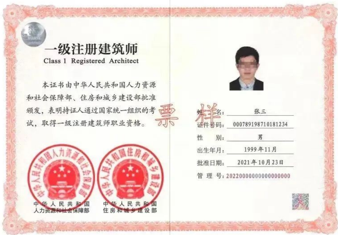
准入类专业技术人员职业资格证书